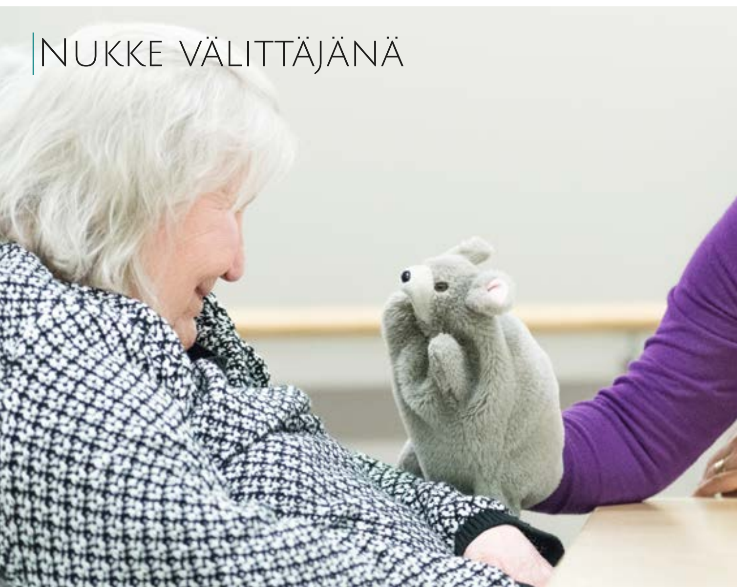
Käsinukke kutsuu asukkaan kohtaamiseen.

Nukketeatterille on ominaista voimakas symbolinen ja metaforinen merkitysten synnyttäminen. Teatterinuken ilmaisumuoto on samalla kertaa visuaalinen ja fyysinen. Katsoja muodostaa sen visuaalisesta olemuksesta, mittakaavasta, liikkeen laadusta, rytmistä, katseesta ja materiaalista oman tulkintansa. Nuken kohdatessamme kohtaamme ajatuksen ja mielikuvan jostakin, emme oikeaa henkilöä. Nuken ja ihmisen väliin jää siis jotakin ehkä sanallisesti vaikeammin tavoitettavaa tulkittavaa, jolloin katsoja vaitonvaraisesti rakentaa merkityksiä hahmolle. Nukke puhuu pelkästään jo olemalla katseen alla eikä tarvitse kovin paljon sanoja tullakseen ymmärretyksi. Katsoja voi muodostaa oman näyttämöllisen sopimuksen suhteessa hahmoon jo näkemällä sen muodon. Nämä sopimuksen syntymisen hetket näkyivät kohtaamisissa monilla eri tavoilla. Useimmiten nukkea hetken katsottuaan osallistujat tekivät päätöksen siitä, kuka tai mikä nukke on, ja alkoivat toimia sen mukaan.