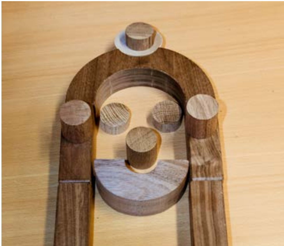
Osallistujan omakuva palikkateatterin keinoin.