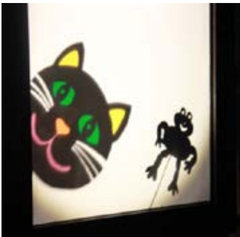
Itse rakennetuilla varjoteatterihahmoilla voi toteuttaa monenlaisia tarinoita.