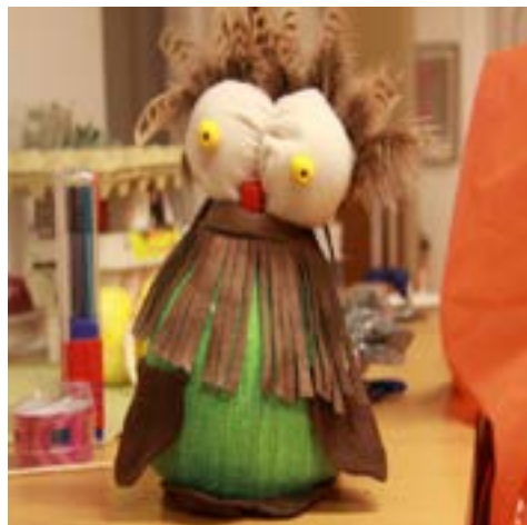
Osallistujan rakentama "Herra Pöllerö" on tekijänsä mukaan menossa etsimään ystävää, mutta on kovin arka ja ujo, eikä oikein uskalla huilla muita.