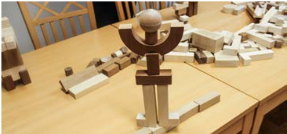
Osallistujan omakuva, jonka voi tulkita esimerkiksi nuorallatanssijaksi.