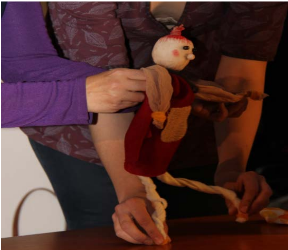
Osallistujan rakentama "Iso Myy" on menossa "sinne, minne elämä vie, ehkä metsään elämään luonnonläheisesti".