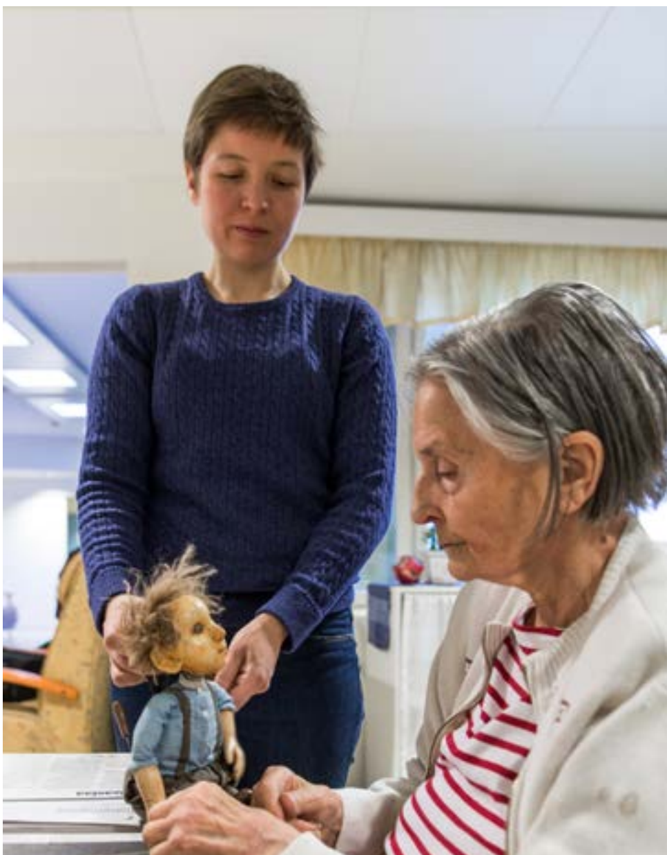
Taneli-pöytäteatterinukke (rakentanut Laura Hallantie) kertoo puisista jaloistaan asukkaalle.

Nainen muistisairautta sairastavien yksikössä on ahdistuneen oloinen, omassa maailmassaan. Hän vaeltaa, hokee sanoja tai irrallisia tavuja. Hoitaja ohjaa nukettajat naisen luo siinä toivossa, että muutos tapahtuisi. Iso pehmonalle ottaa katsekontaktia useaan kertaan. Naisen kasvot kirkastuvat rakkaudelliseen hymyyn. Hän juttelee ja hymyilee nallelle, katsoo silmiin ja halaa. Vieressä oleva, osaston sisustukseen kuuluva matkalaukku huolettaa häntä. Yhdessä nallen kanssa he avaavat sen ja katsovat sinne. Nalle ratkaisee asian ja menee laukkuun nukkumaan. Yhdessä nukettajat laulavat nallelle tuutulaulun. Nainen puristelee nallea: "On ihana."