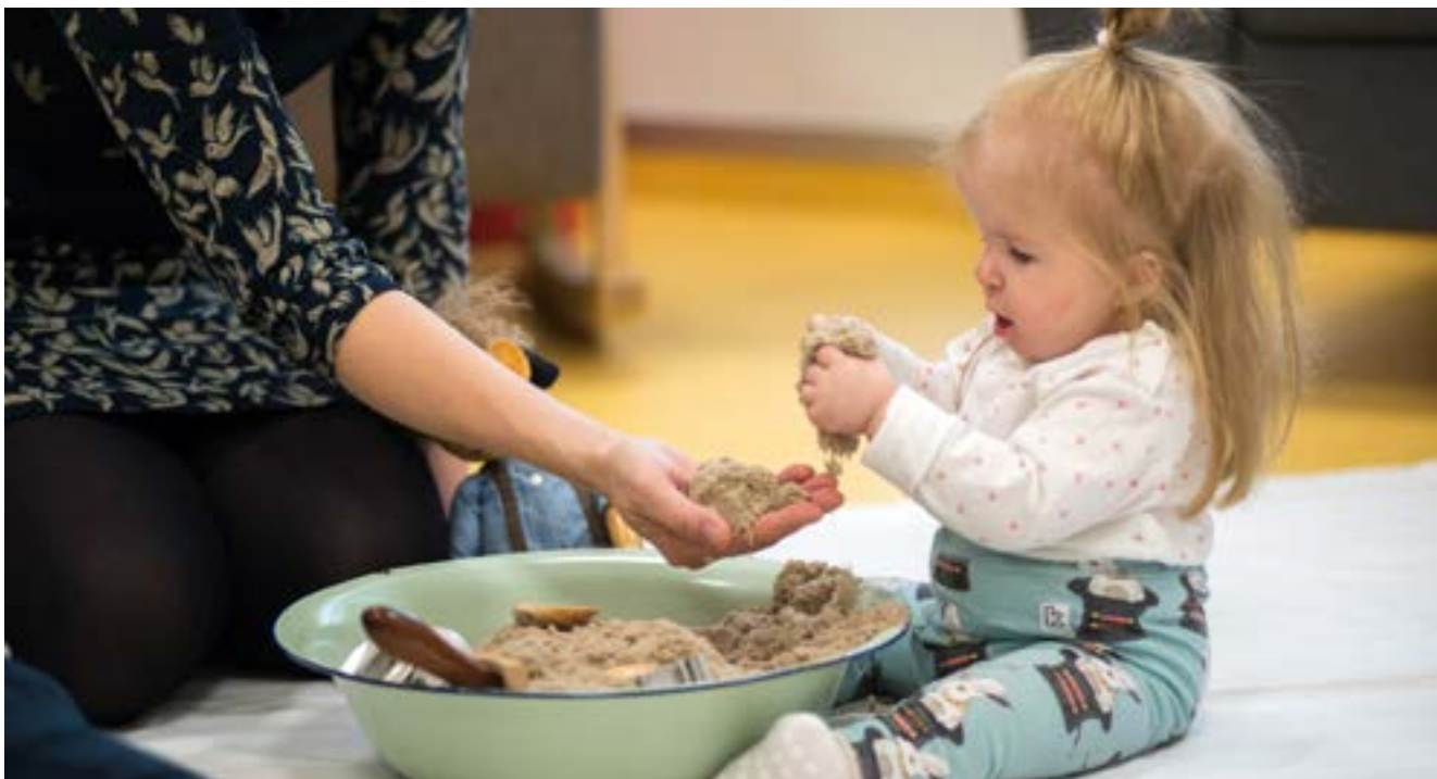
Tyttö tunnustelee kineettistä hiekkaa keskittyneenä.

1-vuotias tyttö lasten kuntoutusosastolla työskentelee intensiivisesti nukkien kanssa jokaisella kerralla. Keskittymisen ja yhdessä kasvamisen saat- taa miltei kuulla tilanteissa. Hän ottaa katsekontaktia nukkeen, koskettelee ja hyppyyttää sitä, liikkuu musiikin tahdissa ja tuntuu imevän kaiken tilanteessa tapahtuvan nopeasti itseensä. Hän vertailee aikuisten ja nukun kasvoja useaan kertaan keskenään. Hän innostuu rapisevasta foliopaperista niin, että koko keho tärisee ja materiaalin olemus siirtyy liikkeeksi. Nukun lähtiessä pois hän osoittaa myös ensimmäistä kertaa pettymyksen tunteen, mikä on uusi kehityksellinen asia.