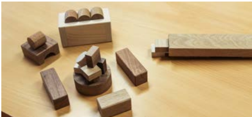
Osallistuja rakensi iselleen tärkeäksi paikaksi rantanuotion ja laiturin.